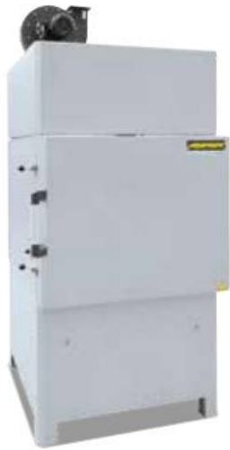
NA 120/45 LS DB with special exhaust gas system

טכנולוגיית הבטיחות של תנורים המשמשים בתהליכים בהם ממסים או חומרים דליקים אחרים משתחררים ומתנדפים במהירות גבוהה יחסית כפופים באירופה לתקן EN 1539. יישומים טיפוסיים הם ייבוש של מרק תבניות, ציפויי פני שטח ושרף הספגה. המשתמשים כוללים את התעשייה הכימית וכן תעשיות נוספות כגון תעשיית הרכב, ייצור הפלסטיק ועיבוד המתכות.